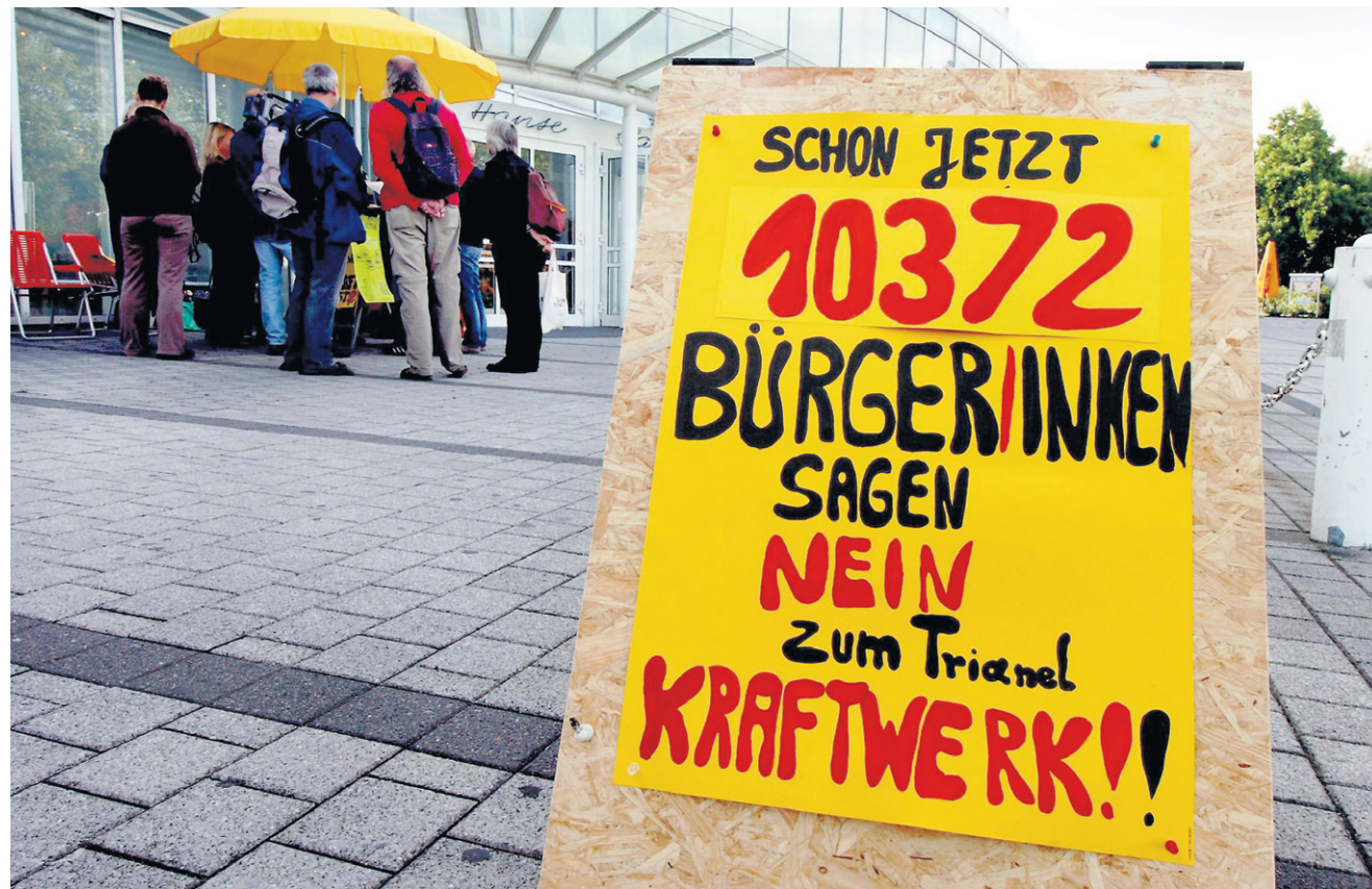
Die Kraftwerksgegner machten schon vor dem Eingang zum Hansesaal auf sich aufmerksam – und informierten die Teilnehmer des Erörterungstermins über die aktuelle Zahl der Protestunterschriften: 10372.