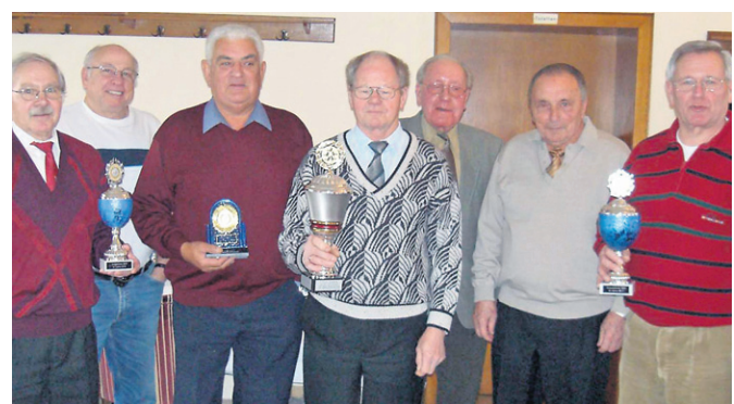
Die erfolgreichen Züchter des Brieftaubenzuchtvereins Hafenpost wurden mit Pokalen ausgezeichnet.

Nach einem gemütlichen Mittagessen gab es einen gemeinsamen Kegelaabend, an dem auch die Frauen teilnahmen.