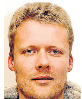
Kritik: Oliver Danne.

Wir fordern daher jeden einzelnen Ratsvertreter auf, das Gebaren und Agieren der wenigen politischen Entscheider kritisch zu hinterfragen (...).