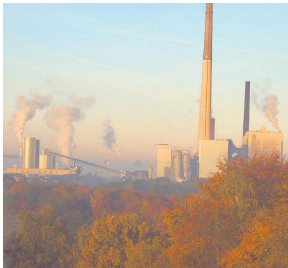
Dieses Foto von der Lünen Industriekulisse (r. Evonik-Kraftwerk, ehemals Steag) machte jetzt ein Leser, der in der Moltkestraße in direkter Nähe des Kühlturms wohnt, aus seinem Wohnzimmerfenster. Er fragt sich, ob wir wirklich neue Kraftwerke brauchen und ob die Luftqualität noch in Ordnung ist.

Aus dem Gedankengut der christlich-demokratischen