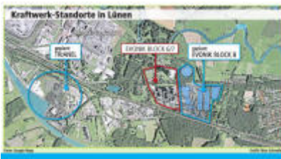
So stellen sich die Kraftwerks-Standorte dar.