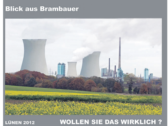
So sehen die Kraftwerksgegner den Blick aus Brambauer im Jahr 2012.

Block 8 soll laut Vorhabenbeschreibung im 4. Quartal 2012 in Betrieb genommen werden.