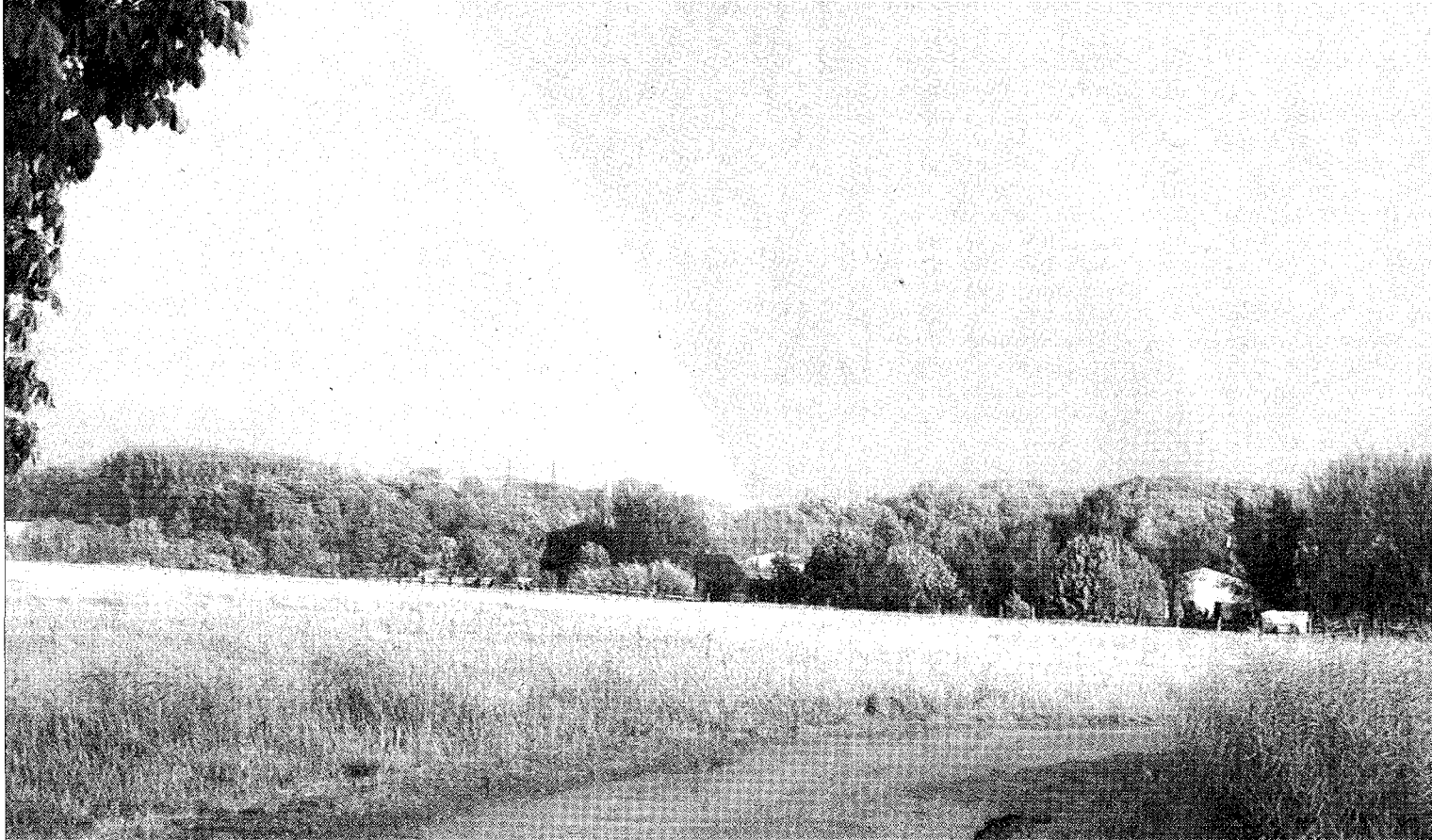
Eine weitere Hochspannungstrasse bleibt dem Mühlenbachtal nun doch erspart. Das Vorhaben war auf massive Proteste gestoßen. Trianel hat nun nach eigenen Angaben auf die Lüner Politik reagiert.

ist eine gute Nachricht für Lünen. Das Mühlenbachtal als wichtiger Naherholungsbe- reich für die Bürger wird nun nicht zusätzlich belastet.“ Evert wies darauf hin, dass die Genehmigung für das Kraftwerk zwar noch gar nicht da sei. Er erwarte aber in Kürze ein Ergebnis.